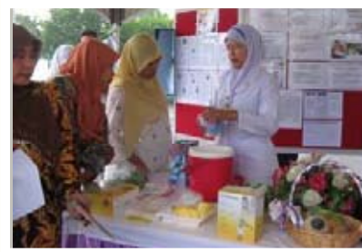
Enfermera enseñando cómo extraerse leche