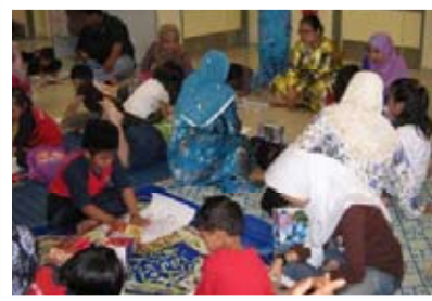
Concurso de pintura para niños.

Debido a limitaciones de recursos económicos se canceló el tercer Foro Global de WABA, originalmente planeado para ser realizado en Junio del 2010 en Québec, Canadá.