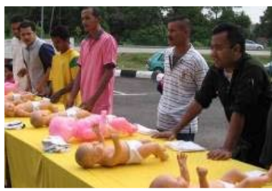
Concurso de cambio de pañales.