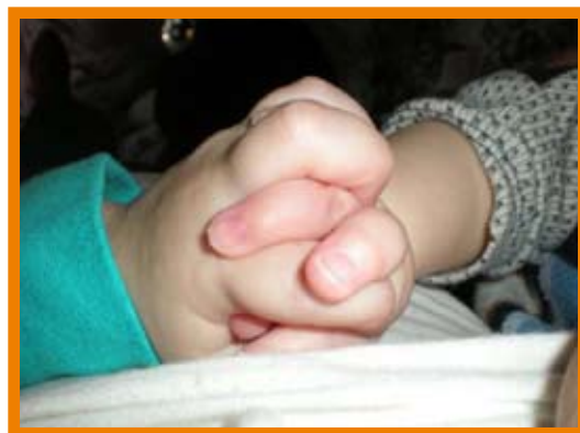
Les deux enfants se tiennent la main pendant la tétée.