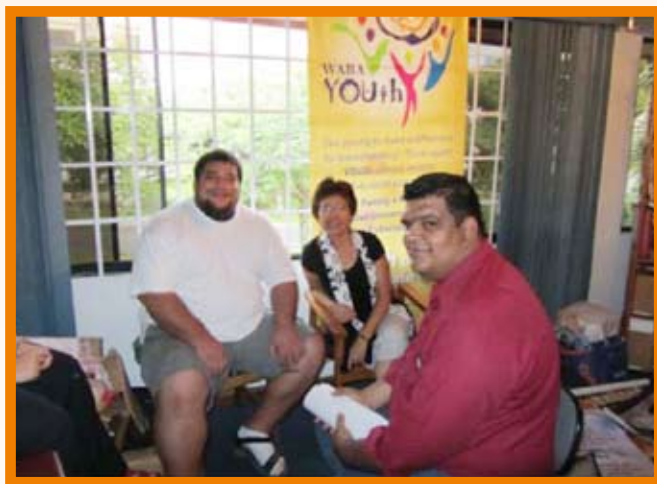
Joueurs de rugby de l’équipe nationale du Costa Rica travaillant avec RUMBA sur des projets pour des jeunes.