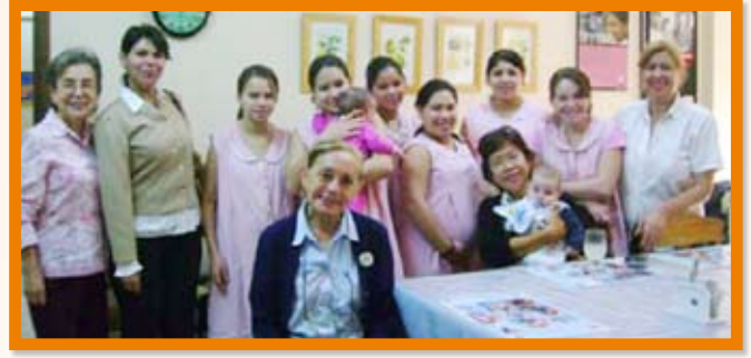
Visite du Foyer des jeunes de la Croix Rouge.