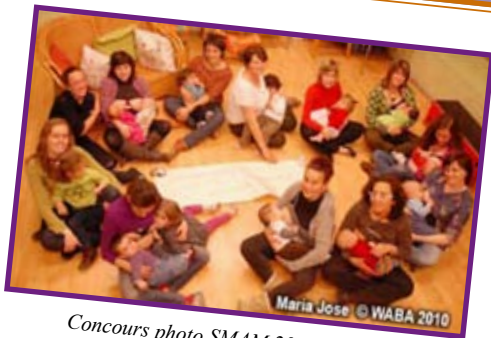
Concours photo SMAM 2010 de WABA

Alliance Mondiale pour l'Allaitement Maternel (WABA)