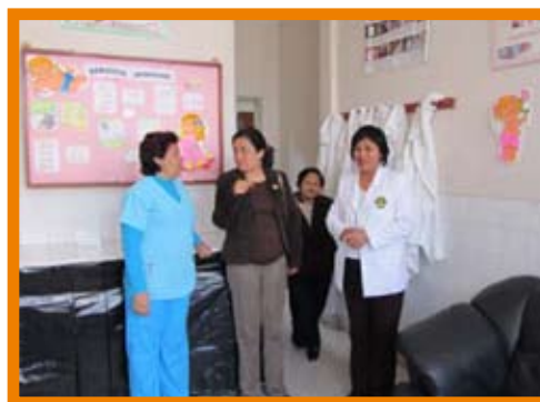
Visite avec le personnel de l’hôpital public, Hospital Nacional Sergio E. Bernales. L’hôpital se situe dans un quartier pauvre d’une ville au nord de Lima.