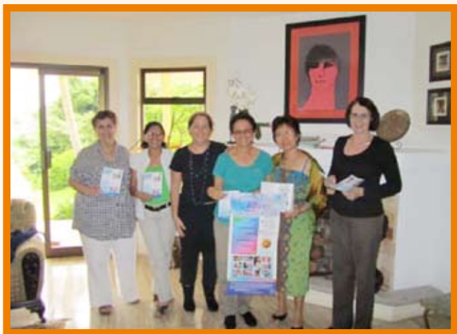
Réunion de planification de la SMAM – groupes de soutien à l’allaitement du Costa Rica.