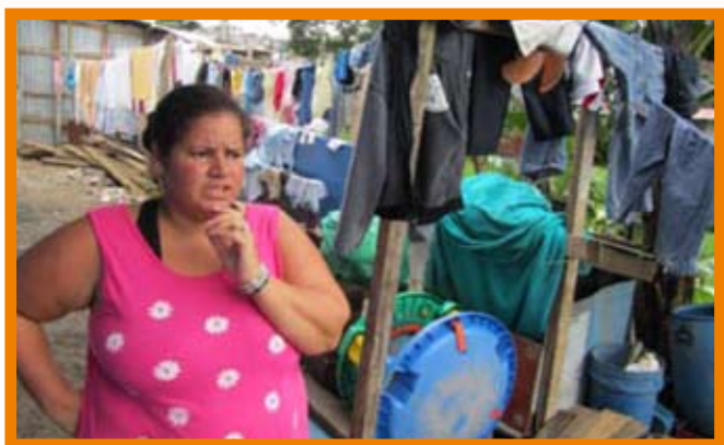
Une participante à un des projets de RUMBA sur des moyens de subsistance autonome. J’ai visité ce projet dans les bidonvilles où Rumba aidait les mères célibataires et les pauvres, leur apportant compétences pratiques et les aidant à gérer leurs finances.