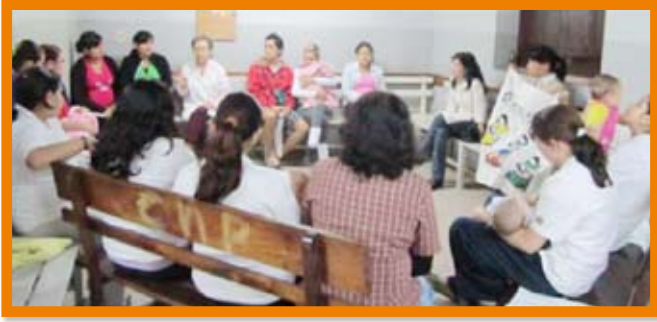
Réunion de groupe de soutien aux mères à l'Hospital Cruz.