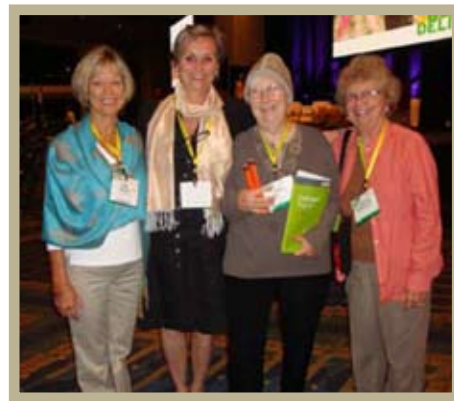
Equipo de Lactancia en la Conferencia WD - ¡Vea los lápices!