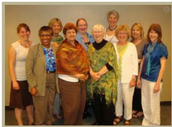
Participantes en la Reunión de WABA-NA posando para la foto

Se revisaron las metas de la II Reunión del 2009 y se decidió deshacer los grupos de trabajo que se habían formado. El equipo que participó en la Conferencia Woman Deliver, informó sobre cómo introdujeron la lactancia materna en el evento internacional y se discutieron las maneras de lograr que la lactancia se pueda convertir en una parte natural de cualquier planificación de conferencias. Sentimos que podíamos tener como blanco a las conferencias en las que podríamos tener presencia, según lo permitieran los fondos, personas y recursos. Durante la reunión se comenzó un grupo de Google para mantener la comunicación y para utilizar el calendario de Google y compartir información sobre reuniones venideras. Discutimos construir sobre el Countdown 2015 (Cuenta Regresiva al 2015) y sobre tener una presencia en esa conferencia, que se desarrollará en la ciudad de Nueva York, del 20 al 22 de setiembre del 2010. Se habló sobre tener una página de facebook de WABA NA. Yendo más allá, sentimos que deberíamos: buscar las oportunidades tal y como llegan; planificando antes, y tomando las cosas proactivamente.