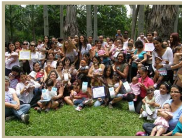
Mamás, bebés y familias en el Acto de Lactancia