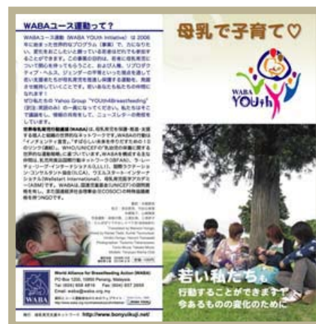
Versión japonesa del Boletín de WABA YOUTH-Joven 2010