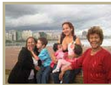
Mamá amamantando gemelas con el apoyo de su hijo, madre y abuelita

Mil quinientas mujeres, rieron y bailaron mientras cargaban a sus hijos/as ¡que amamantaban! Llena de bebés y pequeños/as corriendo, la fiesta de la lactancia materna fue un saludo vivo a los esfuerzos que hacen de Brasil uno de los países más exitosos en la defensa del amamantamiento.